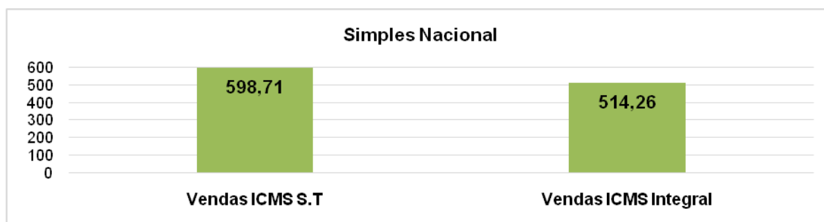
Gráfico 2- Valor das vendas – ICMS-S.T e ICMS Integral.

Se a empresa adquirir produtos com ICMS-S.T e vender por R$ 514,26 , sua margem de lucro seria de 18,5% e na aquisição da mercadoria tributada seria de 30%. Portanto está prática contraria o art. 179 da C.F. As empresas optantes ao Simples Nacional têm o tratamento diferenciado no recolhimento de seus impostos, mas diante dessa situação de substituição tributária acaba sendo desfavorecida (LEI COMPLEMENTAR, 2006).